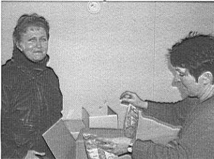
Na zdjęciu: w trakcie wydawania żywności dla podopiecznych GOPS-u.

Gminny Ośrodek Pomocy Społecznej w Kaliskach we współpracy z Bankiem Żywności w Tczewie pozyskał dla swoich podopiecznych 1 tonę żywności: śmietankę 500 kg, makaron 300 kg i ryż 200kg. GOPS w Kaliskach już od paru lat organizuje zbiórki żywności w sklepach „Biedronka” przez swoje podopieczne. W chwili obecnej z tej pomocy skorzysta 100 rodzin, następna pomoc w okolicach Świąt Wielkanocnych.