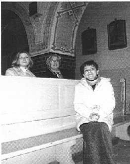
„Serce roście...” - mówią twarze opiekunek młodzieży

Już po raz drugi Kościół Parafialny w Piecach był miejscem montażu poetycko – muzycznego.