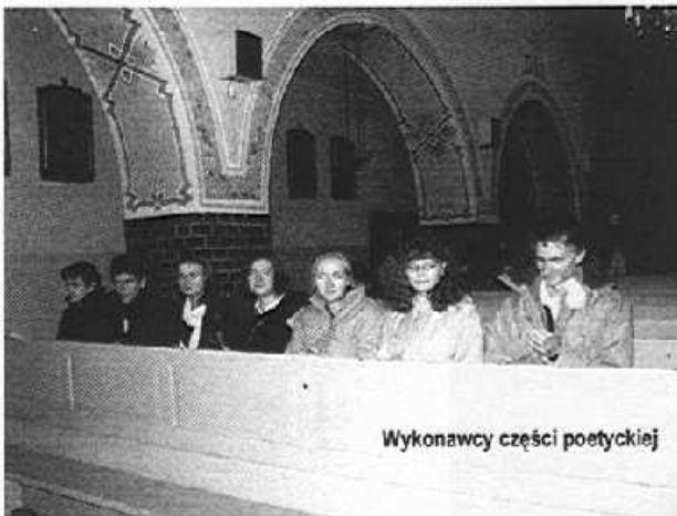
Wykonawcy części poetyckiej