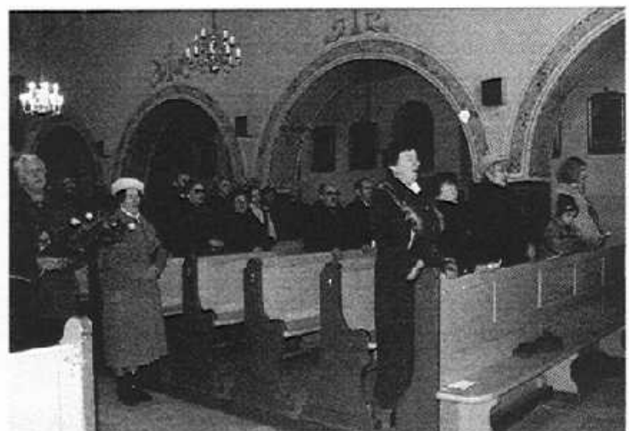
Koncert zakończyło wspólne odśpiewanie pieśni „Boże coś Polskę”