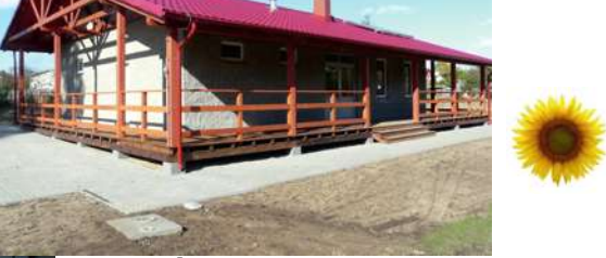
Świetlico - Szatnia w Piecach