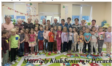
Materialy Klub Seniora w Piecach

W październiku nasi Seniorzy dotarli do budynku ZSP w Kaliskach do klas „0” by wspólnie realizować w ramach projektu „Warsztaty Mydlarskie”. Nie tylko wykonywaliśmy piękne mydelka brokatowe wypełnione naturalnymi kwiatkami, ale również prowadziliśmy szereg pouczających rozmów. Wszyscy cieszyliśmy się z wspólnie spędzonego czasu za co bardzo dziękujemy Pani Wychowawczynie.