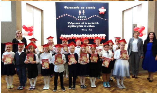
Wychowawczynie klas I