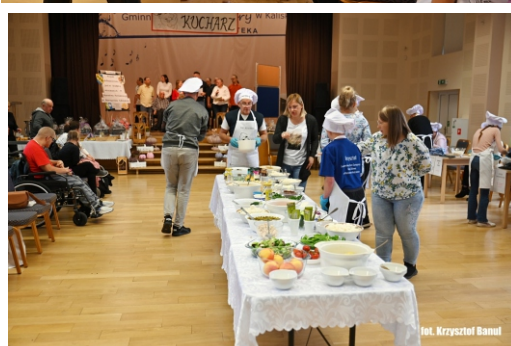
Materiały ŚDS Kaliska

2. października 2023 r. w Czersku podpisano Zintegrowane Porozumienie Terytorialne dla Obszaru Funkcjonalnego Światowego Rezerwatu Biosfery Bory Tucholskie, który skupia 19 gmin z 4 powiatów, chojnickiego, kościerskiego, starogardzkiego oraz bytowskiego.