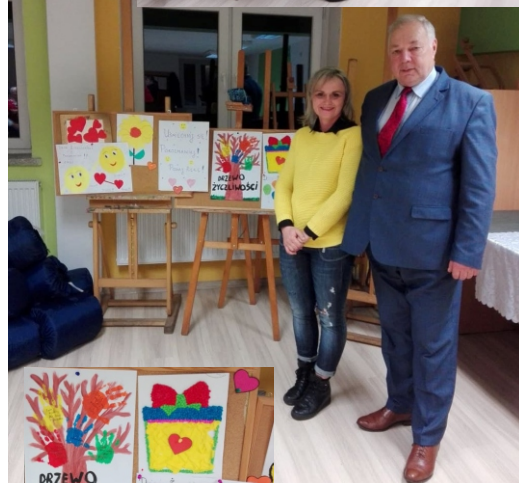
Materiały SRWDN „Dziecko Miłości”