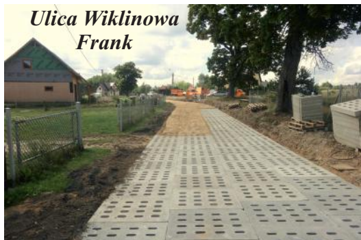
Ulica Wiklinowa Frank

Gmina Kaliska zakończyła realizację budowy kolejnych odcinków nowych dróg. Powstały nowe nawierzchnie z płyt Jomb w sołectwach: *Dąbrowa - ulica Wiklinowa i Różana (kontynuacja), *Iwiczno - ulica Słoneczna - 500 mb - zadanie współfinansowane w ramach środków Marszałka Województwa Pomorskiego, *Studzienice - ulica Borowa (kontynuacja) - zadanie współfinansowane z fuduszy sołectwa. Łącznie powstało 1500mb nowych utwardzeń.