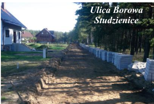
Ulica Borowa Studzienice