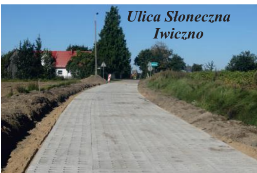
Ulica Słoneczna Iwiczno