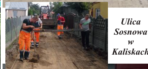
Ulica Sosnowa w Kaliskach