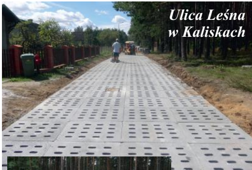
Ulica Leśna w Kaliskach

W przyszłym roku będziemy kontynuować budowę rozpoczętych ulic i realizować większe zadania z udziałem środków unijnych. Mam na myśli budowę ulicy Malinowej i Ogrodowej w Kaliskach wraz z kompleksowym odwodnieniem. Jeszcze czekamy na ostateczną weryfikację wniosków i decyzję w tym zakresie z Urzędu Marszałkowskiego.