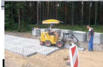
Ulica Nowa w Kaliskach