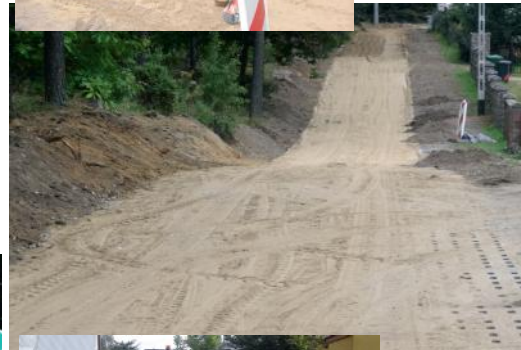
Droga do miejscowości Czarne